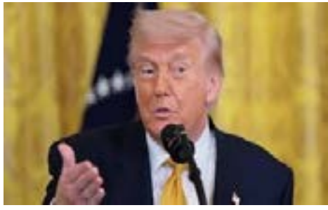
ਵਿਚ ਕਿਹਾ ਕਿ ਜਿਹੜੇ ਜੱਜ ਕੇਸਾਂ ਨੂੰ ਬਿਨਾਂ ਵਜ੍ਹਾ ਲਟਕਾ ਰਹੇ ਹਨ ਜਾਂ ਜਿਨ੍ਹਾਂ ਕੋਲ ਪੁਰਾਣੇ ਕੇਸ ਬਹੁਤ

ਵਾਸ਼ਿੰਗਟਨ- ਪ੍ਰਵਾਸੀਆਂ ਖਿਲਾਫ ਅਮਰੀਕਾ ਦੀ ਕਾਰਵਾਈ ਇਕ ਵਾਰ ਫਿਰ ਤੋਂ ਤੇਜ਼ੀ ਫਤ ਸਕਦੀ ਹੈ। ਰਾਸ਼ਟਰਪਤੀ ਡੋਨਾਲਡ ਟਰੰਪ ਦੇ ਪ੍ਰਸ਼ਾਸਨ ਨੇ ਦੇਸ਼ ਵਿੱਚੋਂ ਗੈਰ-ਕਾਨੂੰਨੀ ਪ੍ਰਵਾਸੀਆਂ ਨੂੰ ਬਾਹਰ ਕੱਢਣ ਦੀ ਪ੍ਰਕਿਰਿਆ ਨੂੰ ਤੇਜ਼ ਕਰਨ ਲਈ ਹੁਣ ਇਮੀਗ੍ਰੇਸ਼ਨ ਅਦਾਲਤਾਂ 'ਤੇ ਸ਼ਿਕੰਜਾ ਕੱਸਣਾ ਸ਼ੁਰੂ ਕਰ ਦਿੱਤਾ ਹੈ। ਅਮਰੀਕੀ ਨਿਆਂ ਵਿਭਾਗ ਨੇ ਸਪੱਸ਼ਟ ਕੀਤਾ ਹੈ ਕਿ ਉਹ ਅਜਿਹੇ ਇਮੀਗ੍ਰੇਸ਼ਨ ਜੱਜਾਂ ਨੂੰ ਅਹੁਦਿਆਂ ਤੋਂ ਤੁਰੰਤ ਹਟਾ ਦੇਵੇਗਾ, ਜੋ ਫੈਸਲੇ ਲੈਣ ਵਿੱਚ ਦੇਰੀ ਕਰ ਰਹੇ ਹਨ ਜਾਂ ਪ੍ਰਸ਼ਾਸਨ ਦੀਆਂ ਸਖ਼ਤ ਨੀਤੀਆਂ ਮੁਤਾਬਕ ਕੰਮ ਨਹੀਂ ਕਰ ਰਹੇ। ਅਮਰੀਕਾ ਦੇ ਕਾਰਜਕਾਰੀ ਅਟਾਰਨੀ ਜਨਰਲ ਟੋਡ ਬਲਾਂਚੇ ਨੇ ਹਾਲ ਹੀ ਵਿੱਚ ਦਿੱਤੇ ਬਿਆਨ