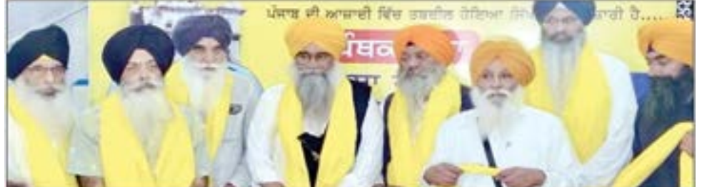
ਨੂੰ ਧੁੰਦਲਾ ਕਰਨ ਲਈ ਹਕੂਮਤੀ ਕੋਸ਼ਿਸ਼ਾਂ ਵਿਰੁੱਧ ਦਲ ਖ਼ਾਲਸਾ ਨੇ ਇਹ ਸੰਮੇਲਨ ਪੰਜਾਬ ਸਰਕਾਰ ਵੱਲੋਂ ਸਿੱਖਾਂ ਨੂੰ ਲਾਮਬੰਦ ਕਰਨਾ ਸੀ। ਦਿਲਚਸਪ ਗੱਲ ਹੈ ਕਿ ਖ਼ੋਅਦਬੀਆਂ ਦੀ ਰੋਕਥਾਮ (ਬਾਕੀ ਸਫਾ ਬੀ-15 ਤੋਂ)

ਧਰਮਕੋਟ, (ਵਰਮਾ) : ਦਲ ਖ਼ਾਲਸਾ ਨੇ ਸ਼ਬਦ-ਗੁਰੂ ਦੀ ਸਰਵ- ਵਿਆਪਕਤਾ, ਅਧਿਆਤਮਿਕਤਾ ਅਤੇ ਵਿਲੱਖਣ ਸਿਧਾਂਤ ਅਤੇ ਸਿੱਖ ਰਵਾਇਤਾਂ ਅੰਦਰ ਕੁਰਬਾਨੀ ਦੀ ਪ੍ਰੰਪਰਾ, ਜਿਸਦੀ ਮਿਸਾਲ ਗੁਰੂਆਂ ਅਤੇ ਇਤਿਹਾਸਕ ਸਿੱਖ ਸ਼ਖਸੀਅਤਾਂ ਨੇ ਸ਼ਹਾਦਤਾਂ ਦੇ ਕੇ ਕਾਇਮ ਕੀਤੀ, ਨੂੰ ਮੁੜ ਦੁਹਰਾਇਆ ਹੈ। ਇਹ ਮਤਾ ਅੱਜ ਸਥਾਨਕ ਗੁਰਦੁਆਰਾ ਸਿੰਘ ਸਭਾ ਵਿੱਚ ਸਿੱਖ ਜਥੇਬੰਦੀ ਦਲ ਖ਼ਾਲਸਾ ਵੱਲੋਂ ਕਰਵਾਏ ਗਏ ਪੰਥਕ ਸੰਮੇਲਨ ਵਿੱਚ ਪਾਸ ਕੀਤਾ ਗਿਆ। ਸਮਾਗਮ ਦਾ ਉਦੇਸ਼ ਸ਼ਬਦ ਗੁਰੂ ਦੇ ਸਿਧਾਂਤ ਤੇ ਹੋ ਰਹੇ ਹਮਲੇ, ਗੁਰੂ ਗ੍ਰੰਥ ਸਾਹਿਬ ਦੇ ਸਰੂਪਾਂ ਦਾ ਅਪਮਾਨ ਅਤੇ ਖ਼ਾਲਸਾ ਰਾਜ ਦੇ ਸੰਕਲਪ