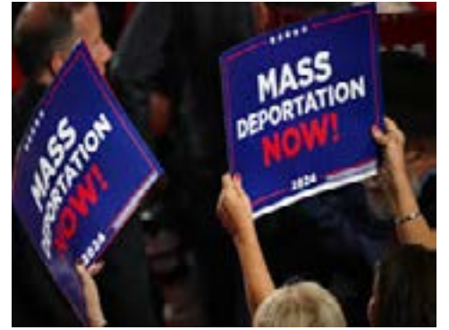
ਅਤੇ ਇਟਾਲੀਅਨ ਲੋਕਾਂ ਨੂੰ ਕੈਦ ਕਰਨ ਦੇ ਨਾਲ ਹੀ ਜਾਪਾਨੀ-ਅਮਰੀਕੀ ਨਾਗਰਿਕਾਂ ਨੂੰ ਸਮੂਹਿਕ ਨਜ਼ਰਬੰਦ ਕਰਨ ਲਈ ਵੀ ਕੀਤੀ ਗਈ ਸੀ।

ਯੂ. ਅਤੇ ਡੈਮੋਕਰੇਸੀ ਫਾਰਵਰਡ ਦੁਆਰਾ ਦਾਇਰ ਇੱਕ ਕੇਸ ਦੀ ਸੁਣਵਾਈ ਦੌਰਾਨ ਕਿਹਾ, "ਮੈਨੂੰ ਨਹੀਂ ਲੱਗਦਾ ਕਿ ਮੈਂ ਹੋਰ ਇੰਤਜ਼ਾਰ ਕਰ ਸਕਦਾ ਹਾਂ ਅਤੇ ਮੈਨੂੰ ਕਾਰਵਾਈ ਕਰਨੀ ਪਵੇਗੀ।" ਉਸ ਫੈਸਲੇ ਤੋਂ ਕੁਝ ਘੰਟੇ ਪਹਿਲਾਂ ਟਰੰਪ ਨੇ 1798 ਦੇ ਏਲੀਅਨ ਐਨੀਮੀਜ਼ ਐਕਟ ਦੀ ਵਰਤੋਂ ਕਰਕੇ ਦਾਅਵਾ ਕੀਤਾ ਕਿ ਵੈਨੇਜ਼ੁਏਲਾ ਦਾ ਗੈਰ ਟ੍ਰੇਨ ਡੀ ਅਰਾਗੁਆ ਸੰਯੁਕਤ ਰਾਜ ਅਮਰੀਕਾ 'ਤੇ ਹਮਲਾ ਕਰ ਰਿਹਾ ਸੀ। ਇਹ ਐਕਟ ਰਾਸ਼ਟਰਪਤੀ ਨੂੰ ਵੱਡੇ ਪੱਧਰ 'ਤੇ ਦੇਸ਼ ਨਿਕਾਲੇ ਨੂੰ ਤੇਜ਼ ਕਰਨ ਲਈ ਨੀਤੀ ਅਤੇ ਕਾਰਜਕਾਰੀ ਕਾਰਵਾਈ ਦੇ ਸਬੰਧ ਵਿਚ ਵਿਆਪਕ ਅਧਿਕਾਰ ਦਿੰਦਾ ਹੈ। ਇਹ ਐਕਟ ਅਮਰੀਕੀ ਇਤਿਹਾਸ ਵਿਚ ਸਿਰਫ ਤਿੰਨ ਵਾਰ ਵਰਤਿਆ ਗਿਆ ਹੈ ਅਤੇ ਉਹ ਵੀ ਸਿਰਫ ਯੁੱਧ ਸਮੇਂ। ਪਹਿਲਾਂ ਇਸ ਦੀ ਵਰਤੋਂ ਦੂਜੇ ਵਿਸ਼ਵ ਯੁੱਧ ਦੌਰਾਨ ਕੀਤੀ ਗਈ ਸੀ। ਉਸ ਸਮੇਂ ਇਸਦੀ ਵਰਤੋਂ ਜਰਮਨ