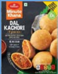
"Deep Fried Pastries stuffed with Lentils & spices"