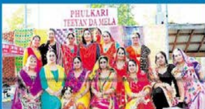
ਸਿਆਟਲ ਫੁਲਕਾਰੀ ਤੀਆਂ ਦੇ ਮੇਲੇ ਦੀ ਤਿਆਰੀ ਕਰਦੀਆਂ ਪ੍ਰਬੰਧਕਾਂ।