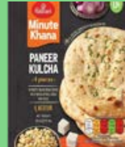
"Authentic Indian Bread stuffed with Indian Cottage Chees & spices"