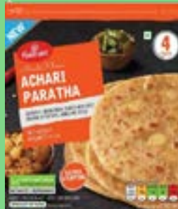
"Authentic Indian Bread Stuffed with Spicy Mixture of Potatoes & Spices"

Haldiram's stuffed parathas – hearty, flavorful, and perfect for a quick meal or snack!