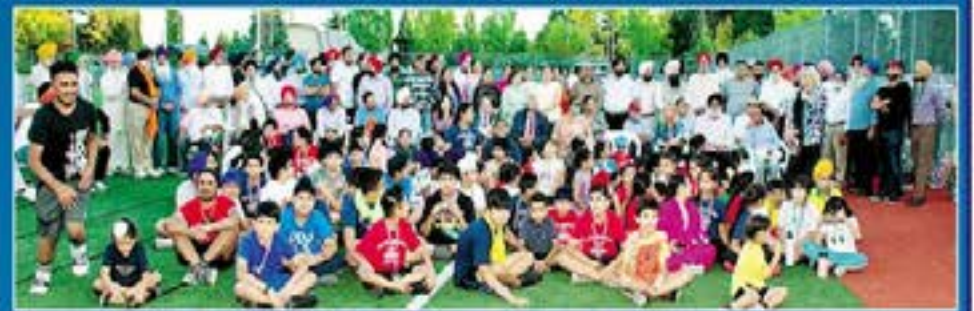
ਪਿਛਲੇ ਸਾਲਾਂ ਦੇ ਖੇਡ ਕੈਂਪ ਦੀਆਂ ਝਲਕੀਆਂ।