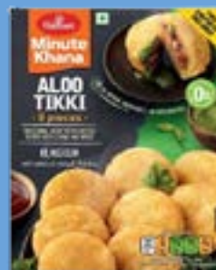
"Traditional Crispy Potato Patties stuffed with lentils & spices"