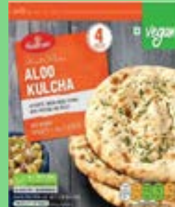
"Authentic Indian Bread stuffed with Potatoes & spices"