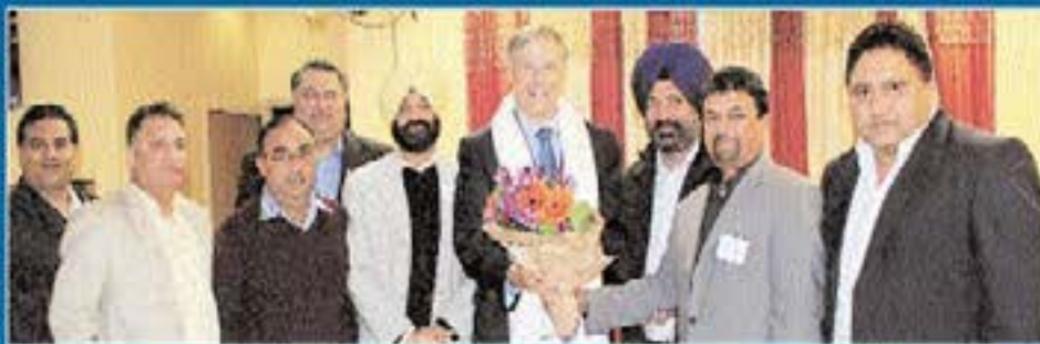
ਪੰਜਾਬੀ ਭਾਈਚਾਰੇ ਵੱਲੋਂ ਵਾਸ਼ਿੰਗਟਨ ਸਟੇਟ ਦੇ ਗਵਰਨਰ ਜੇ. ਇਨਸਲੀ ਦਾ ਸਵਾਗਤ।