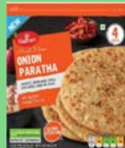
"Authentic Indian Bread stuffed with Onions,Herbs & spices"