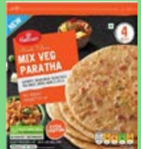
"Authentic Indian Bread stuffed with Vegetables,Herbs & spices"