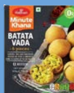
"Authentic Snack made from Mashed Potatoes & Spices,Deep Fried"