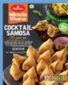
"Delicious & Crispy bite size filled with Boiled Potatoes & Spices"