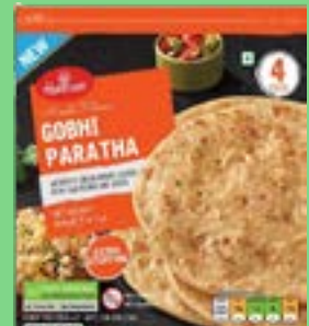
"Authentic Indian Bread Stuffed with Cauliflower & Spices"