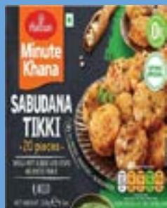
"Tapioca Patty Blended with Potato & Roasted peanut"