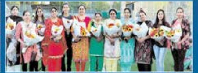
ਫੁਲਕਾਰੀ ਤੀਆਂ ਦੇ ਮੇਲੇ ਦੀਆਂ ਪ੍ਰਬੰਧਕਾਂ ਸਨਮਾਨਿਤ।