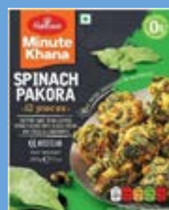
"Fritters made from Chopped Spinach along with Sliced Onions Condiments"