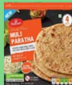
"Authentic Indian Bread Stuffed with White Radish,Herbs & Spices"