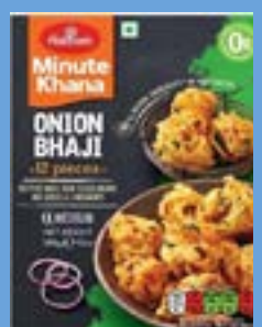
"Fritters Made From Selected Onions & Spices & Condiments"