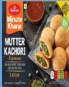
"Deep Fried Pastries stuffed with Lentils & spices"