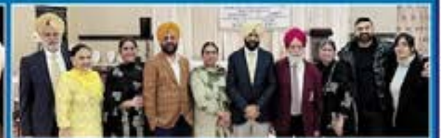
ਹਾਜ਼ਰ ਪੰਜਾਬੀ ਭਾਈਚਾਰੇ ਦੇ ਲੋਕ।