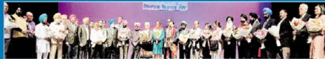
ਪੰਜਾਬੀ ਭਾਈਚਾਰੇ ਦੀ ਮਾਣ-ਮੱਤੀਆਂ ਸ਼ਖਸੀਅਤਾਂ ਦਾ ਵਿਸ਼ੇਸ਼ ਸਨਮਾਨ।