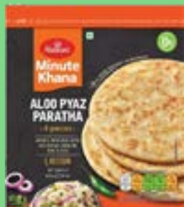
"Authentic Indian Bread stuffed with Potatoes ,Onion,Herbs & Spices"