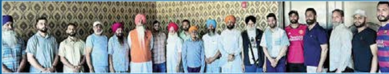
ਪ੍ਰਬੰਧਕਾਂ ਤੇ ਕੋਚਿੰਗ ਸਾਹਿਬਾਨਾਂ ਦੀ ਮੀਟਿੰਗ ਤੋਂ ਬਾਅਦ ਸਾਂਝੀ ਫੋਟੋ।

ਸਤਿਕਾਰਯੋਗ ਜੀਉ, ਆਪ ਜੀ ਨੂੰ ਜਾਣ ਕੇ ਖੁਸ਼ੀ ਹੋਵੇਗੀ ਕਿ ਹਰੇਕ ਸਾਲ ਦੀ ਤਰ੍ਹਾਂ ਇਸ ਸਾਲ ਵੀ ਬੱਚਿਆਂ ਦਾ ਖੇਡ ਕੈਂਪ 6 ਜੁਲਾਈ, ਦਿਨ ਸ਼ਨਿਚਰਵਾਰ, ਸ਼ਾਮ 5 ਵਜੇ ਅਰਦਾਸ ਕਰਕੇ ਸ਼ੁੱਭ ਆਰੰਭ Wilson Play Fields Kent WA. 13028 SE. 251st. Kent, WA - 98030 ਵਿਖੇ ਕੀਤਾ ਜਾ ਰਿਹਾ ਹੈ, ਜਿੱਥੇ ਹਰੇਕ ਸ਼ਨਿਚਰਵਾਰ ਤੇ ਐਤਵਾਰ 5 ਤੋਂ 7 ਵਜੇ ਤੱਕ ਬੱਚਿਆਂ ਨੂੰ ਸਰੀਰਕ ਫਿਟਨੈੱਸ ਦੀ ਟ੍ਰੇਨਿੰਗ ਤੇ ਵੱਖ-ਵੱਖ ਖੇਡਾਂ ਵਿਚ ਕੋਚਿੰਗ ਮੁਹੱਈਆ ਕੀਤੀ ਜਾਵੇਗੀ ਅਤੇ ਬੱਚਿਆਂ ਨੂੰ ਪੰਜਾਬੀ ਵਿਰਸੇ ਤੇ ਪੰਜਾਬੀ ਸੱਭਿਆਚਾਰ ਨਾਲ ਜੋੜਨ ਦਾ ਉਪਰਾਲਾ ਕੀਤਾ ਜਾਵੇਗਾ। ਬੱਚਿਆਂ ਤੋਂ ਕੋਈ ਫੀਸ ਨਹੀਂ, ਸਗੋਂ ਦਾਨੀਆਂ ਵੱਲੋਂ ਖੇਡ-ਕਿੱਟਾਂ ਤੇ ਰਿਫਰੈਸ਼ਮੈਂਟ ਸੇਵਾ ਕੀਤੀ ਜਾਵੇਗੀ। ਇਹ ਪੰਜਾਬੀ ਭਾਈਚਾਰੇ ਦਾ ਸਾਂਝਾ ਕੈਂਪ ਹੈ। ਕਿਸੇ ਨਾਲ ਕੋਈ ਵਿਤਕਰਾ ਨਹੀਂ। ਦਾਨੀਆਂ ਵੱਲੋਂ ਮੁਫਤ ਖਰਚਾ ਸਪਾਂਸਰ ਕੀਤਾ ਜਾ ਰਿਹਾ ਹੈ।