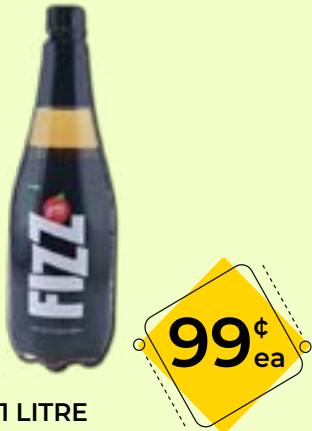
APPY FIZZ 1 LITRE