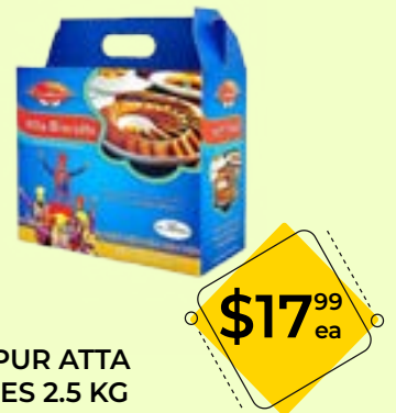
LYALLPUR ATTA COOKIES 2.5 KG