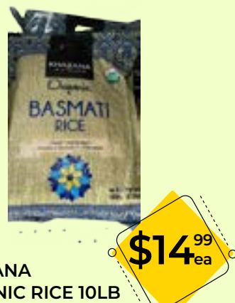
KHAZANA ORGANIC RICE 10LB