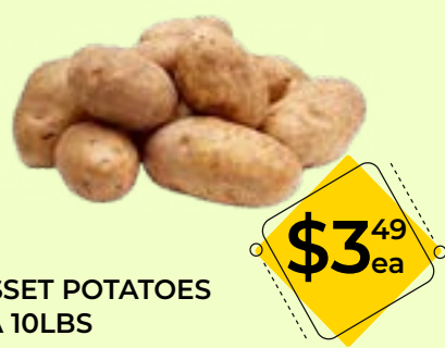
RUSSET POTATOES USA 10LBS