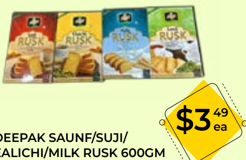
DEEPAK SAUNF/SUJI/EALICHI/MILK RUSK 600GM