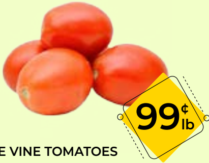
ON THE VINE TOMATOES