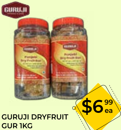
GURUJI DRYFRUIT GUR 1KG