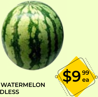
BIG WATERMELON SEEDLESS