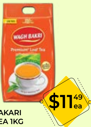
WAGH BAKARI LOOSE TEA 1KG