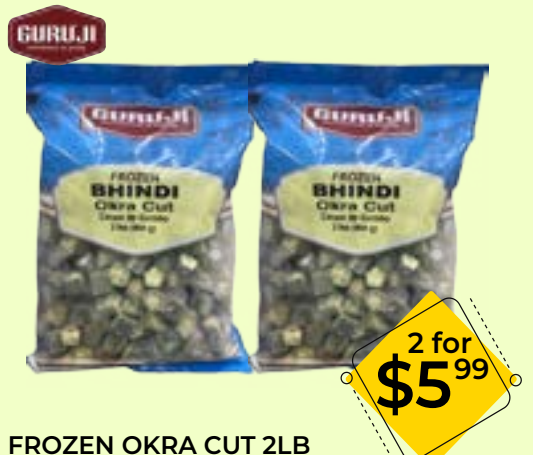
FROZEN OKRA CUT 2LB