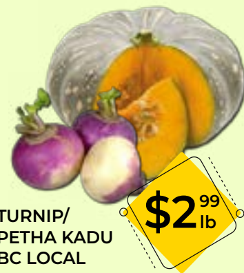
TURNIP/PETHA KADU BC LOCAL