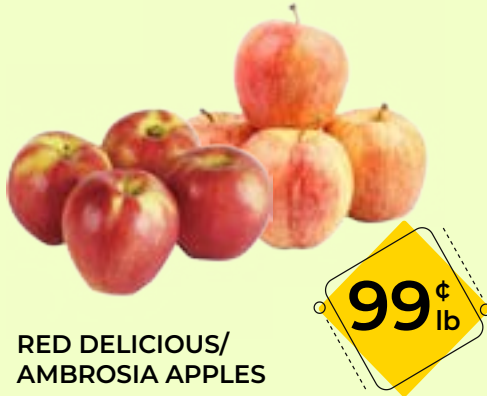
RED DELICIOUS/AMBROSIA APPLES