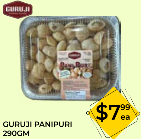
GURUJI PANIPURI 290GM