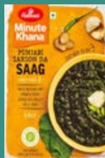
Haldiram's Punjabi Sarson Da Saag