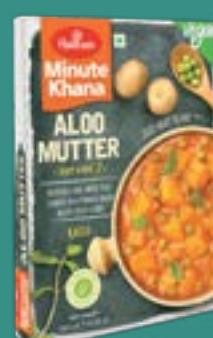
Haldiram's Aloo Mutter