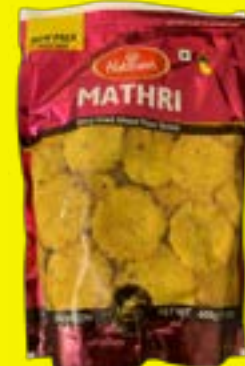
Haldiram's Mathri 350g