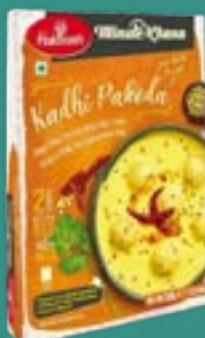
Haldiram's Kadhi Pakoda