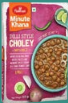
Haldiram's Dilli Style Choley

Ready to Eat Minute Khana Just Heat & Eat.