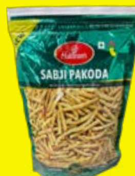
Haldiram's Sabji Pakoda 400g