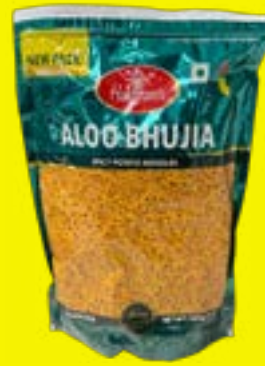
Haldiram's Aloo Bhujia 400g

The Ultimate Evening Snacks! Get Yours now from Haldiram's