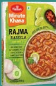
Haldiram's Rajma Raseela