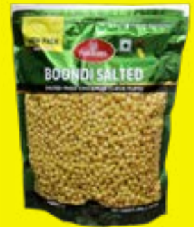
Haldiram's Boondi Salted 400g