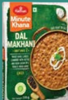
Haldiram's Dal Makhani