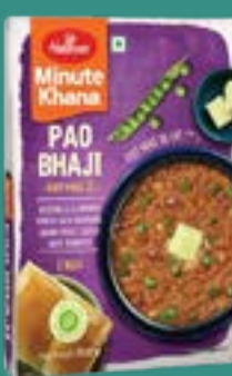
Haldiram's Pao Bhaji