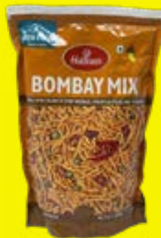
Haldiram's Bombay Mix 400g