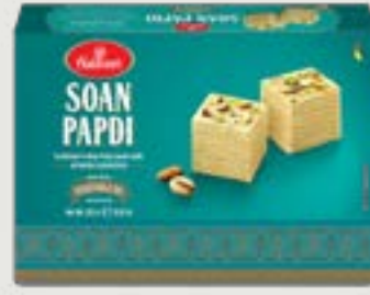
Haldiram's Soan Papdi 250g