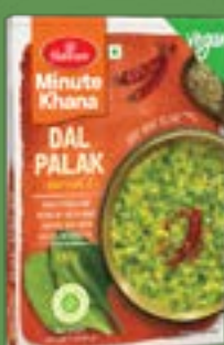
Haldiram's Dal Palak