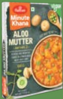
Haldiram's Aloo Mutter

"Heat, Eat, Enjoy! A variety of quick Curries for every taste bud."