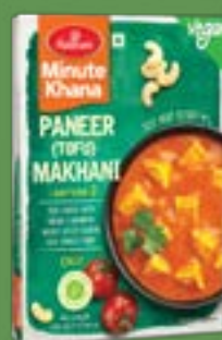
Haldiram's Paneer Makhani

"Heat, Eat, Enjoy! A variety of quick Curries for every taste bud."