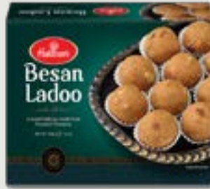
Haldiram's Besan Ladoo 400g

Make Everyday Perfect with Haldiram's Sweets.