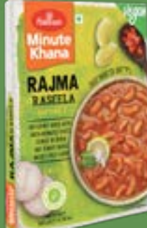
Haldiram's Rajma Raseela