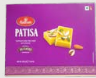
Haldiram's Patisa 500g