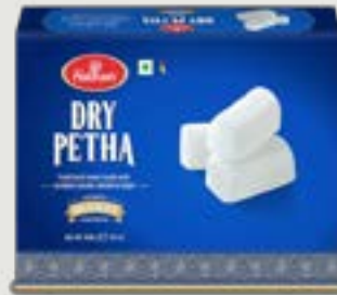
Haldiram's Dry Petha 400g