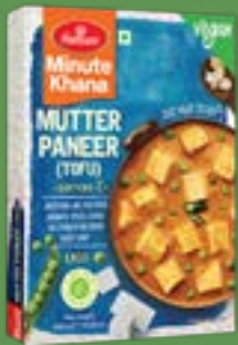
Haldiram's Mutter Paneer