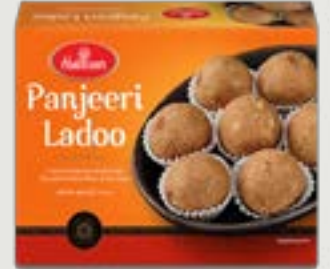
Haldiram's Panjeeri Ladoo 250g