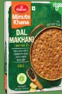
Haldiram's Dal Makhani