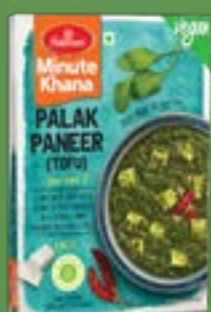
Haldiram's Palak Paneer