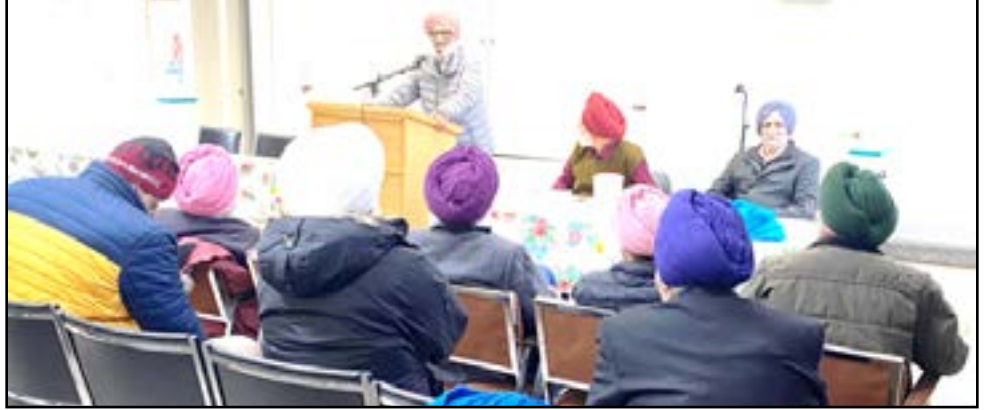
ਬਰਾੜ ਨੇ ਸਾਰਿਆਂ ਦਾ ਧੰਨਵਾਦ ਕੀਤਾ। ਚਾਰ ਪਾਣੀ ਮਹੀਨੇ ਦੇ ਆਖਰੀ ਐਤਵਾਰ ਨੂੰ ਫਿਰ ਇਕੱਠੇ ਹੋਣ ਦੀਆਂ ਦੀ ਸੇਵਾ ਸੀਨੀਅਰ ਸੈਂਟਰ ਵੱਲੋਂ ਕੀਤੀ ਗਈ। ਅਗਲੇ ਰੀਝਾਂ ਦਿਲ ਵਿੱਚ ਲੈ ਕੇ ਸਭ ਘਰਾਂ ਨੂੰ ਵਿਦਾ ਹੋਏ।