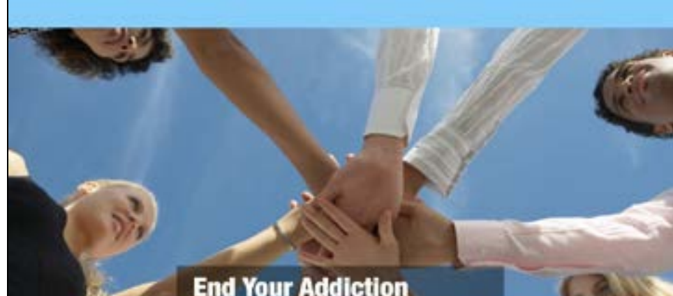
End Your Addiction at Night and Day Recovery Centre

ਜੇ ਤੁਸੀਂ ਸ਼ਰਾਬ ਜਾਂ ਨਸ਼ੇ ਛੱਡਣਾ ਚਾਹੁੰਦੇ ਹੋ ਤਾਂ ਅਸੀਂ ਤੁਹਾਡੀ ਮੱਦਦ ਕਰ ਸਕਦੇ ਹਾਂ। ਅੱਜ ਹੀ ਆ ਕੇ ਮਿਲੋ।