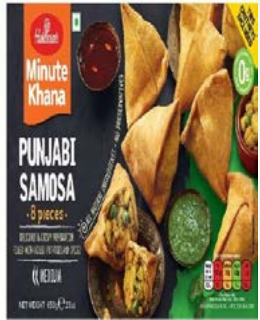
"Delicious & Crispy Preperation filled with Boiled Potatoes & Spices"