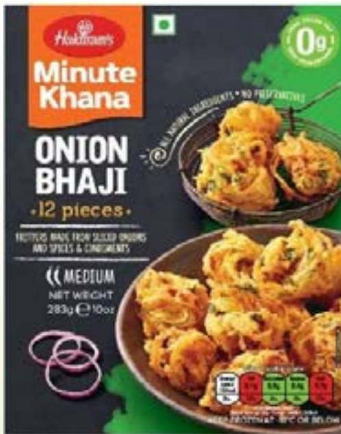
"Fritters Made From Selected Onions & Spices & Condiments"