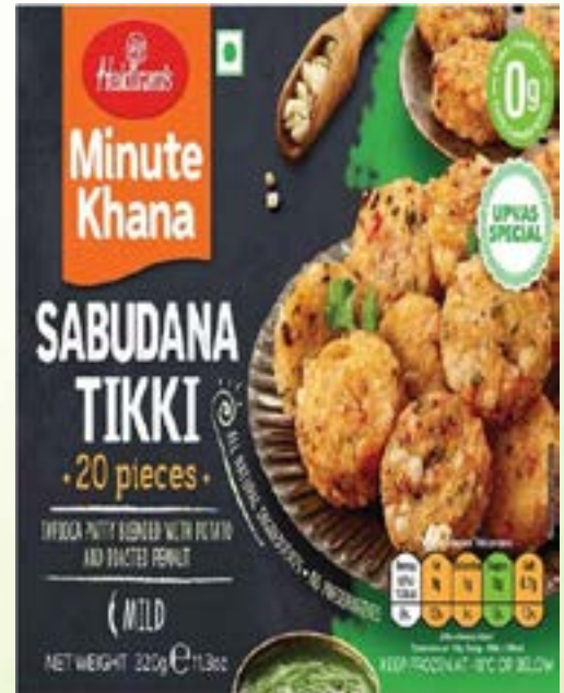
"Tapioca Patty Blended with Potato & Roasted peanut"

EXPLORE MORE RANGE OF PRODUCTS AT WWW.RESHMISGROUP.COM