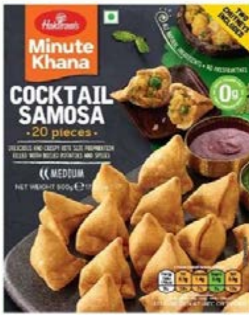
"Delicious & Crispy bite size Preperation filled with Boiled Potatoes & Spices"