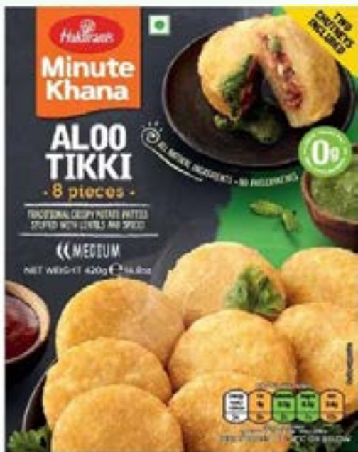
"Traditional Crispy Potato Patties stuffed with lentils & spices"