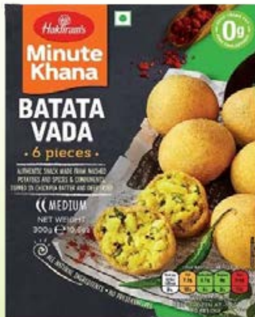
"Authentic Snack made from Mashed Potatoes & Spices, Dipped in Chickpea Batter & Deep Fried"