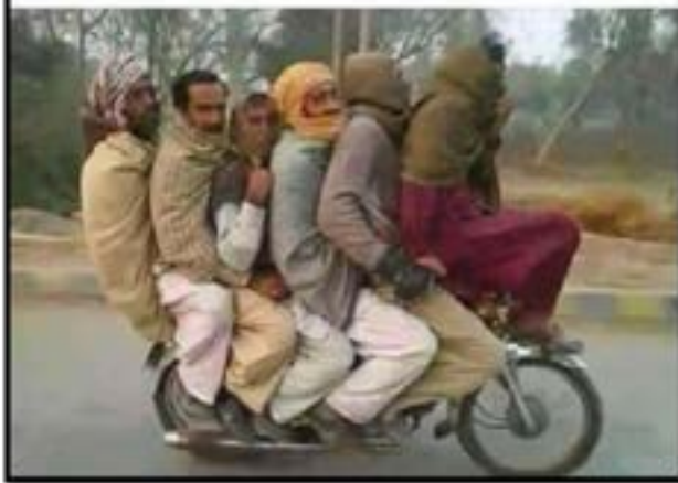
ਉਹ ਤਾ ਬੜਾ ਮਿੱਠਾ ਸੀ।

ਦਿੱਲੀ ਵਿੱਚ ਛੇ ਮਜਦੂਰ ਮੋਟਰ ਸਾਈਕਲ ਤੇ ਦਿਹਾੜੀ ਕਰਨ ਲਈ ਜਾਂਦੇ ਹਨ। ਉਨ੍ਹਾਂ ਨੂੰ ਦੇਖ ਕੇ ਟਰੈਫਿਕ ਪੁਲੀਸ ਵਾਲੇ ਨੇ ਰੁਕਣ ਦਾ ਇਸ਼ਾਰਾ ਕੀਤਾ। ਇੱਕ ਮਜਦੂਰ ਕਹਿੰਦਾ ਪਾਗਲ ਹੋ ਗਿਆ ਤੂੰ ਕਿਥੇ ਬੈਠੇਗਾ ਭਾਈ?