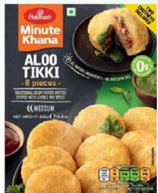
"Traditional Crispy Potato Patties stuffed with lentils & spices"