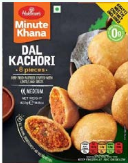
"Deep Fried Pastries stuffed with Lentils & spices"