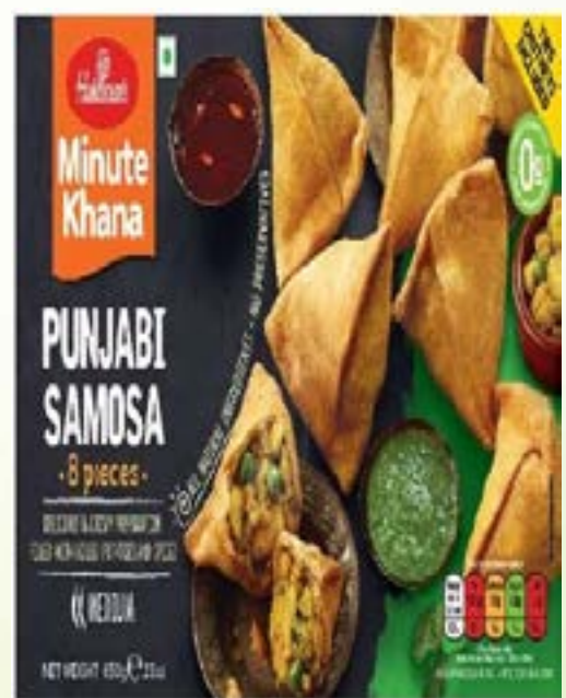
"Delicious & Crispy Preparation filled with Boiled Potatoes & Spices"

EXPLORE MORE RANGE OF PRODUCTS AT WWW.RESHMISGROUP.COM