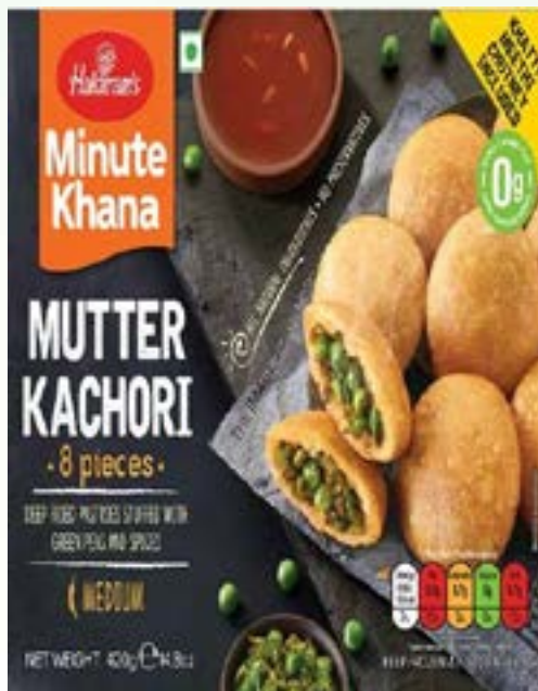
"Deep Fried Pastries stuffed with Lentils & spices"