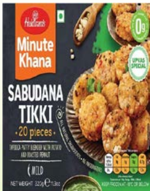
"Tapioca Patty Blended with Potato & Roasted peanut"