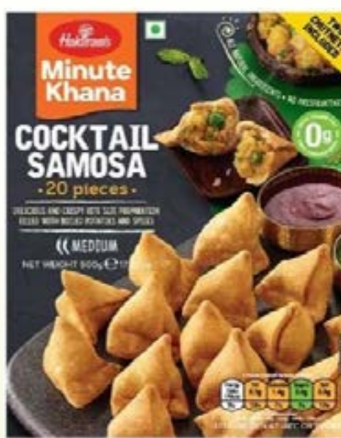
"Delicious & Crispy bite size Preparation filled with Boiled Potatoes & Spices"