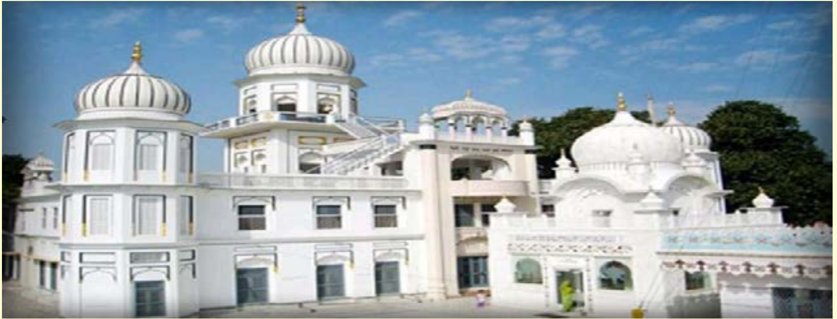
ਗੁਰੂ ਪਿਆਰੀ ਸਾਧ ਸੰਗਤ ਜੀ ਵਾਹਿਗੁਰੂ ਜੀ ਕਾ ਖਾਲਸਾ ਵਾਹਿਗੁਰੂ ਜੀ ਕੀ ਫਤਹਿ

ਆਦਿ ਅੰਤ ਮੱਧ ਪੂਰਨ ਓਂਕਾਰ ਮਮ ਰੂਪ। ਸਤਿਗੁਰ ਕੇ ਪ੍ਰਸਾਦਿ ਸੇ ਜਾਨਿਯੇ ਰੂਪ ਅਨੂਪ।।