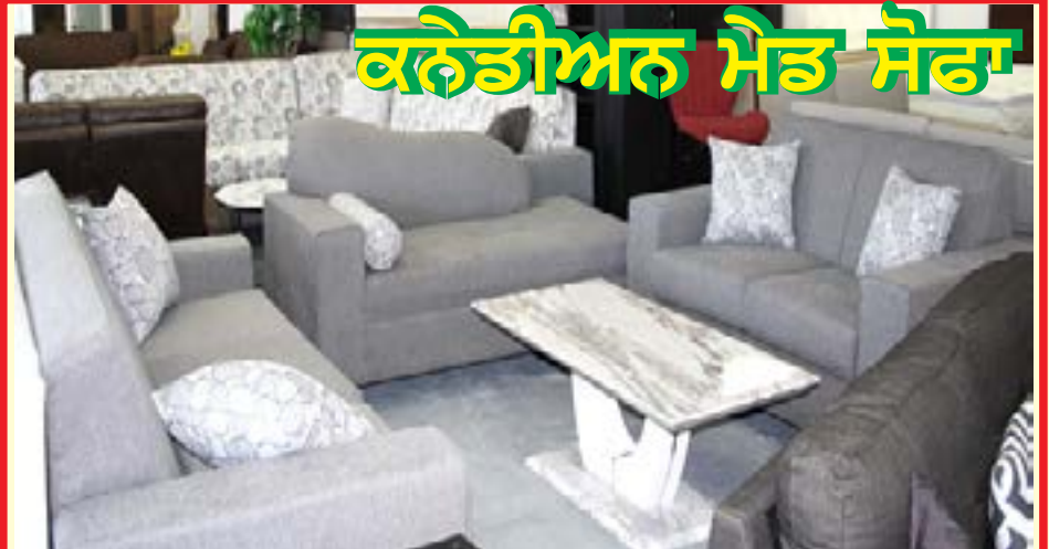
ਕਨੇਡੀਅਨ ਮੈਡ ਸੋਫਾ

ਵੱਖ ਵੱਖ ਤਰ੍ਹਾਂ ਦੇ ਕੱਪੜੇ ਅਤੇ ਰੰਗਾਂ, ਹਾਰਡ/ਮੀਡੀਅਮ/ਸੌਫਟ ਫੋਮ ਵਿਚ