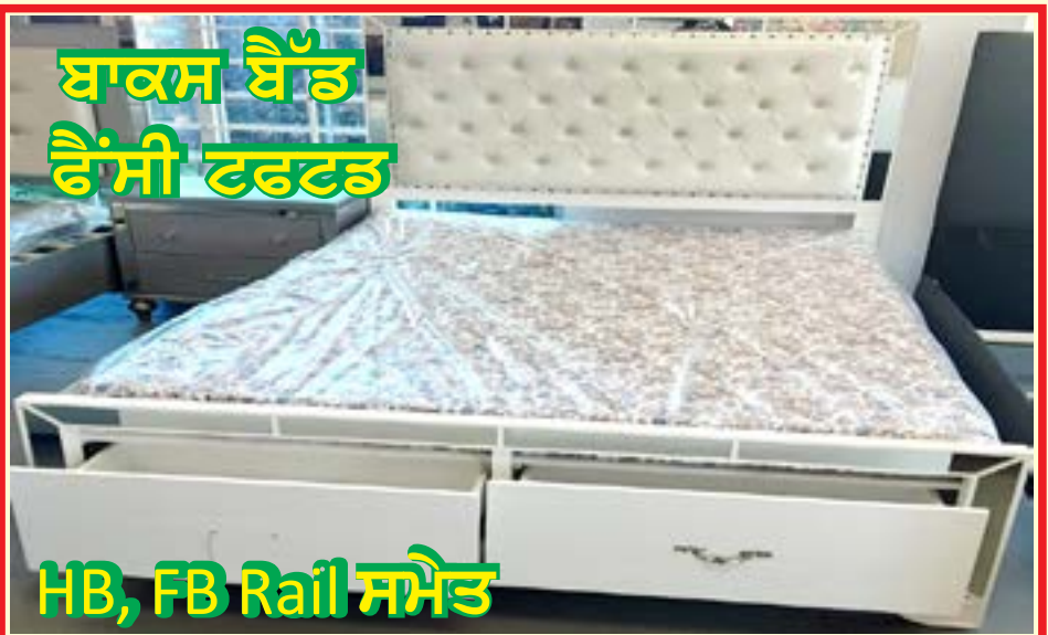
ਬਾਕਸ ਬੈੱਡ ਫੈਂਸੀ ਫਰਫਟ