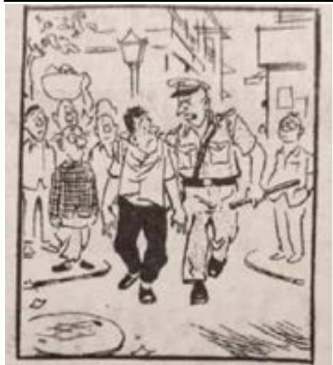
Of course you weren't spreading rumours - the charge is you were spreading facts! - R K Laxman (Dec 26, 1962)

ਧਰਾ ਬਣ ਰਿਹਾ ਹੈ, ਜਿਸ ਕਾਰਨ ਮਨੁੱਖੀ ਅਧਿਕਾਰਾਂ ਦੀ ਅਣਦੇਖੀ ਹੋ ਰਹੀ ਹੈ ਅਤੇ ਦੁਨੀਆ ਦਾ ਧਿਆਨ ਇਸ ਪਾਸੇ ਨਹੀਂ ਜਾ ਰਿਹਾ ਹੈ।