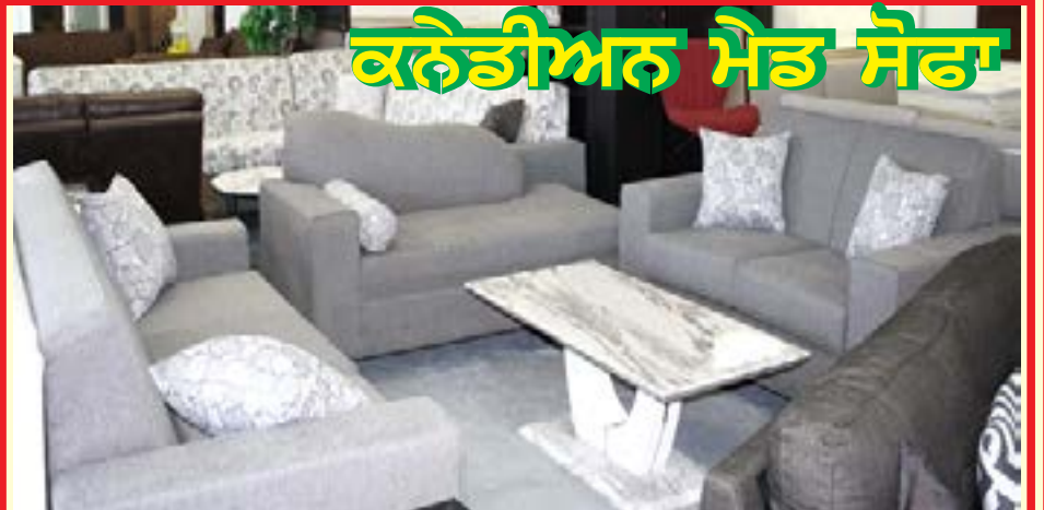
ਕਨੇਡੀਅਨ ਮੈਡ ਸੋਫਾ

ਵੱਖ ਵੱਖ ਤਰ੍ਹਾਂ ਦੇ ਕੱਪੜੇ ਅਤੇ ਰੰਗਾਂ, ਹਾਰਡ/ਮੀਡੀਅਮ/ਸੌਫਟ ਫੋਮ ਵਿਚ