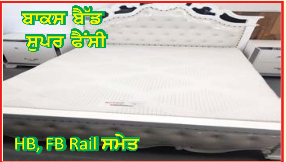
ਬਾਕਸ ਬੈੱਡ ਸੁਪਰ ਫੈਂਸੀ