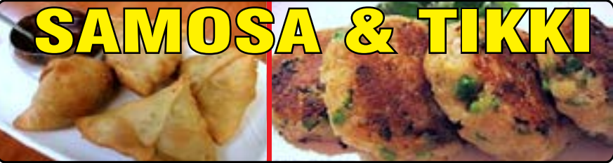
SAMOSA & TIKKI

ਅਸੀਂ ਜਿੰਨੇ ਮਰਜ਼ੀ ਬੰਦਿਆਂ ਦੀ ਕੋਟਰਿੰਗ ਵੀ ਕਰਦੇ ਹਾਂ