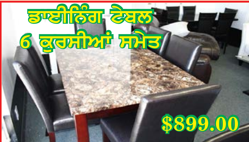
ਡਾਈਨਿੰਗ ਟੇਬਲ 6 ਕੁਰਸੀਆਂ ਸਮੇਤ

ਵੱਖ ਵੱਖ ਤਰ੍ਹਾਂ ਦੇ ਕੱਪੜੇ ਅਤੇ ਰੰਗਾਂ, ਹਾਰਡ/ਮੀਡੀਅਮ/ਸੌਫਟ ਫੋਮ ਵਿਚ