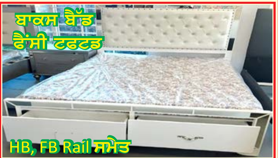
ਬਾਕਸ ਬੈੱਡ ਫੈਂਸੀ ਟਰਟਲ