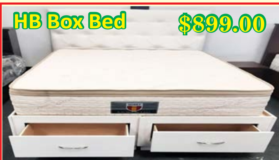
HB Box Bed $899.00