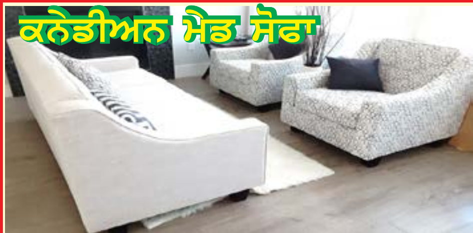
ਕਨੇਡੀਅਨ ਮੈਡ ਸੋਫਾ

7743-128St Surrey, BC (Opposite to Subway)