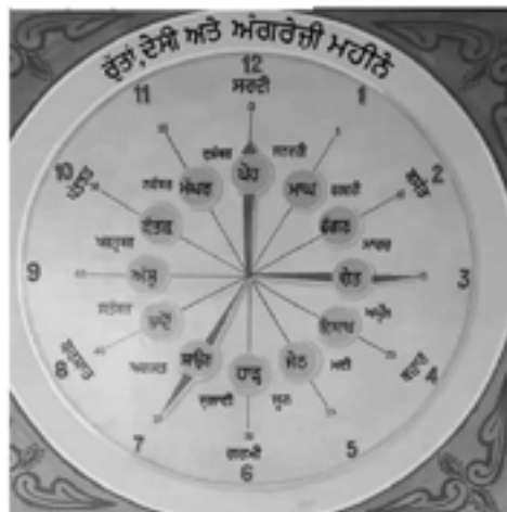
ਸੋਹਣੇ ਤਰੀਕੇ ਨਾਲ ਦੇਸ਼ੀ ਮਹੀਨਿਆਂ ਬਾਰੇ ਸਮਝਾਇਆ ਗਿਆ

ਵਿਗਿਆਨ ਵਿੱਚ ਉਹ ਪਰਿਭਾਸ਼ਿਤ ਕਰਨਾ ਜ਼ਰੂਰੀ ਹੈ ਜੋ ਸੰਭਵ ਤੌਰ 'ਤੇ ਸਭ ਤੋਂ ਵਧੀਆ ਮਾਪ 'ਤੇ ਅਧਾਰ ਹੈ। ਇਸ ਦੇ ਨਾਲ, ਸਮੇਂ ਨੂੰ ਅਤਿ-ਸਹੀ ਤਰੀਕੇ ਨਾਲ ਮਾਪਣ ਨਾਲ ਸਾਨੂੰ ਪਹਿਲਾਂ ਗਲਤ ਸਮਝੇ ਗਏ ਵਰਤਾਰੇ ਨੂੰ ਸਮਝਣ ਵਿੱਚ ਮਦਦ ਮਿਲੇਗੀ। ਐੱਨਆਈਐੱਸਟੀ ਸਮਝਾਉਂਦਾ ਹੈ, ਕਿ ਉਦਾਹਰਨ ਵਜੋਂ ਆਈਨਸਟਾਈਨ ਦੇ 'ਸਾਪੇਖਤਾ ਦੇ ਸਿਧਾਂਤ' ਵੱਲੋਂ ਵਿਆਖਿਅਤ ਸਪੇਸ-