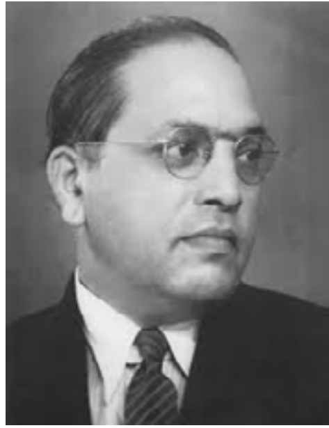
ਨੂੰ ਪ੍ਰਣਾਮ ਕਰਦੇ ਹਾਂ ਤਾਂ ਉਨ੍ਹਾਂ ਦੇ ਪਾਏ ਪੂਰਨਿਆਂ ਤੋਂ ਚੱਲਣ ਲਈ ਦ੍ਰਿੜਤਾ ਅਤੇ ਦੂਰ ਦ੍ਰਿੜਤੀ ਵੀ ਪੈਦਾ ਕਰਨੀ ਹੋਵੇਗੀ।

ਦਲਿਤ ਸਮਾਜ ਜਦੋਂ ਤੱਕ ਆਪਣੀ ਹੋਂਦ ਅਤੇ ਆਪਣੇ ਮੂਲ ਦੀ ਸਹੀ ਪਛਾਣ ਨਹੀਂ ਕਰਦਾ ਉਦੋਂ ਤੱਕ ਸ਼ੋਸ਼ਣ