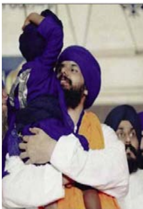
ਇਹ ਅਵਸਥਾ ਜੀਵਨ ਅਤੇ ਮੌਤ ਨੂੰ ਇੱਕ ਸਮਾਨ ਕਰ ਸ਼ਹਾਦਤ ਦੇ ਪੁਜਾਰੀ ਬਣਾ ਦਿੰਦੀ ਹੈ। ਇਸ ਅਵਸਥਾ ਵਿੱਚ ਪਹੁੰਚਿਆ ਵਿਅਕਤੀ ਕੌਮੀ ਲੜਾਈ ਅੰਦਰ