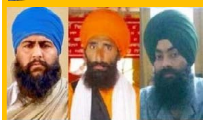
Three Sikh Youths Sentenced to Life Just for Possessing Printed Material About Sikh Martyrs