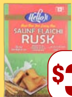
ਹੈਲੋ ਜੀ ਰੱਸ Hello ji Saunf Elaichi & Milk Rusk