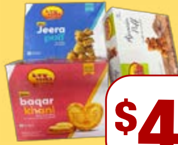
ਵੇਰਕਾ ਪੱਫ Verka Assorted Khari Puff