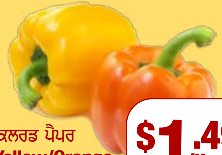
ਕਲਰਡ ਪੈਪਰ Yellow/Orange Pepper