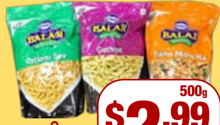
ਨਮਕੀਨਜ਼ Balaji Assorted Namkeen