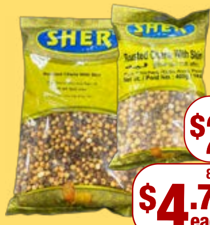
ਭੁੰਨਿਆ ਚਨਾ (ਸਾਬਤ) Sher Chana with skin