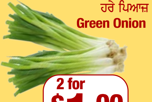
ਹਰੇ ਪਿਆਜ਼ Green Onion