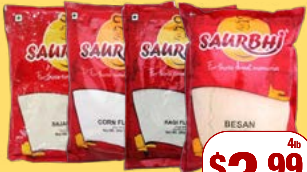
ਸੌਰਭੀ ਐਸਾਰਟਿਡ ਆਟਾ Saurbhi/Hello Ji Flour Bajari Flour/Corn Flour/ Ragi Atta/Besan