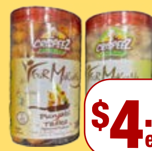
ਮਖਾਣਾ Crispez flavoured makhana assorted