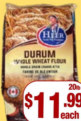
ਹੀਰ ਚਪਾਤੀ ਆਟਾ Heer Whole Grain Atta