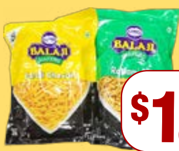
ਨਮਕੀਨਜ਼ Balaji Assorted Namkeen