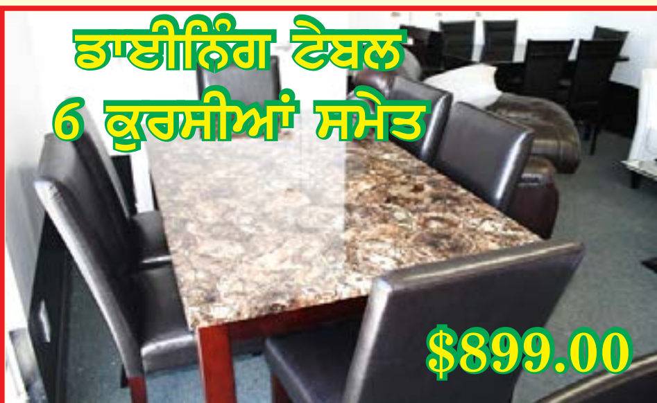
ਡਾਈਨਿੰਗ ਟੇਬਲ 6 ਕੁਰਸੀਆਂ ਸਮੇਤ

ਵੱਖ ਵੱਖ ਤਰ੍ਹਾਂ ਦੇ ਕੱਪੜੇ ਅਤੇ ਰੰਗਾਂ, ਹਾਰਡ/ਮੀਡੀਅਮ/ਸੌਫਟ ਫੋਮ ਵਿਚ