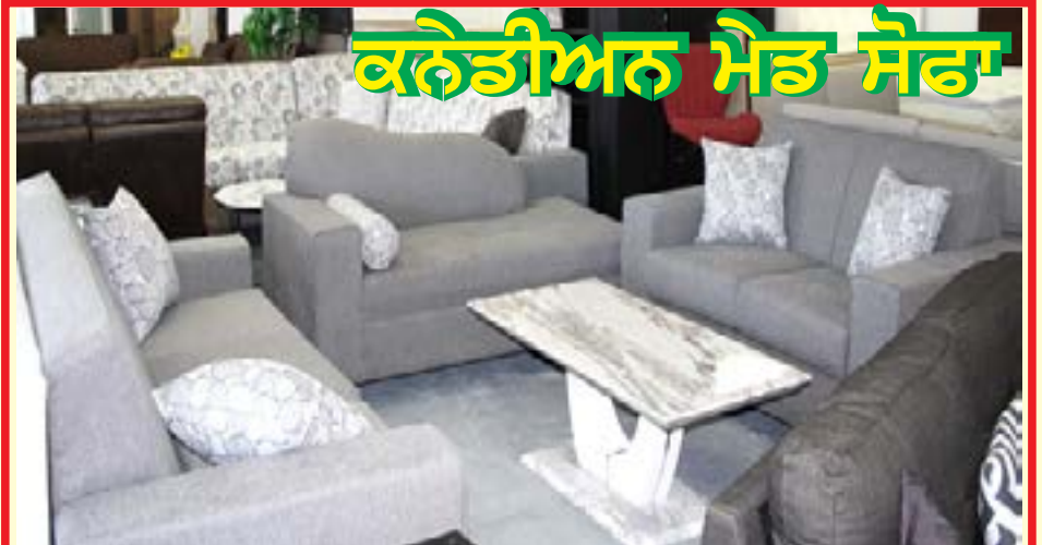
ਕਨੇਡੀਅਨ ਮੈਡ ਸੋਫਾ

ਵੱਖ ਵੱਖ ਤਰ੍ਹਾਂ ਦੇ ਕੱਪੜੇ ਅਤੇ ਰੰਗਾਂ, ਹਾਰਡ/ਮੀਡੀਅਮ/ਸੌਫਟ ਫੋਮ ਵਿਚ