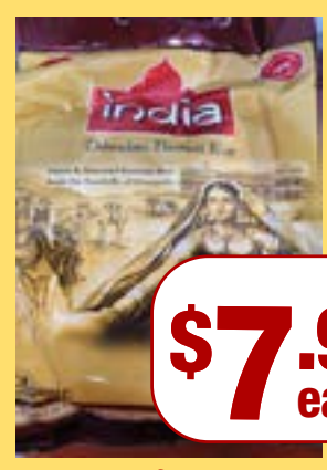
ਬਾਸਮਤੀ ਚਾਵਲ India at Home Dehradun Basmati Rati