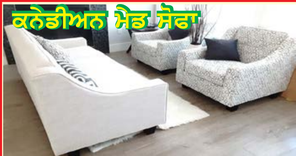
ਕਨੇਡੀਅਨ ਮੈਡ ਸੋਫਾ

7743-128St Surrey, BC (Opposite to Subway)