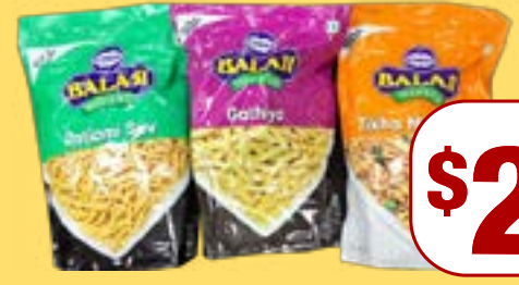
ਨਮਕੀਨਜ਼ Balaji Assorted Namkeen