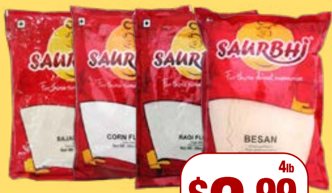
ਸੌਰਭੀ ਐਸਾਰਟਿਡ ਆਟਾ Saurbhi Flour