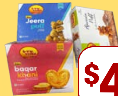
ਵੇਰਕਾ ਪੱਫ Verka Assorted Khari Puff