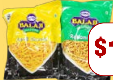
ਨਮਕੀਨਜ਼ Balaji Assorted Namkeen