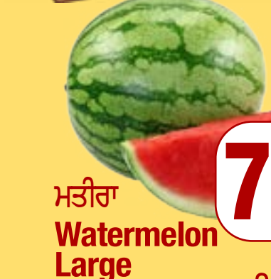
ਮਤੀਰਾ Watermelon Large