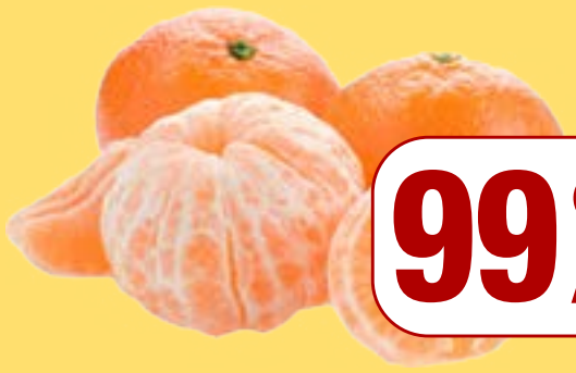
ਸੰਤਰੇ Small Oranges