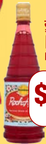
ਰੂਹਆਫਜ਼ਾ Roohafza Indian/Pakistani