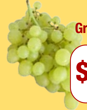
ਹਰੇ ਅੰਗੂਰ Green Grapes