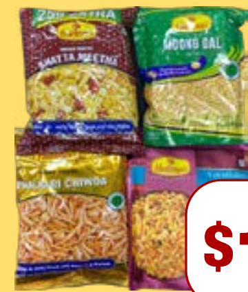
ਹਲਦੀਰਾਮ ਨਮਕੀਨ Haldiram Assorted Namkeen