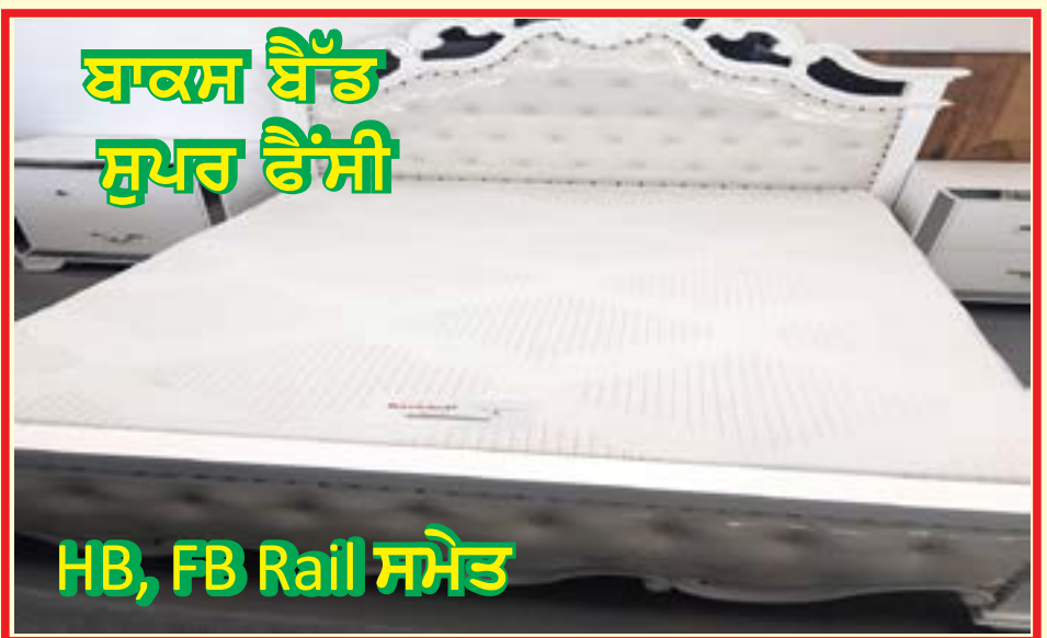
ਬਾਕਸ ਬੈੱਡ ਸੁਪਰ ਫੈਂਸੀ