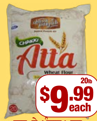
ਸ਼ਾਨ-ਏ-ਪੰਜਾਬ ਆਟਾ Shaan-e-Punjab Chakki Atta