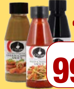
ਚਿੰਗ ਸਾਸ (ਐਸਾਰਟਿਡ) Ching's Sauce Greenchilli/Red Chilli/ Dark Soya