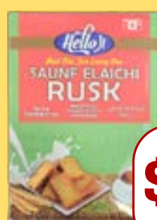
ਹੈਲੋ ਜੀ ਰੱਸ Hello ji Saunf Elaichi & Milk Rusk