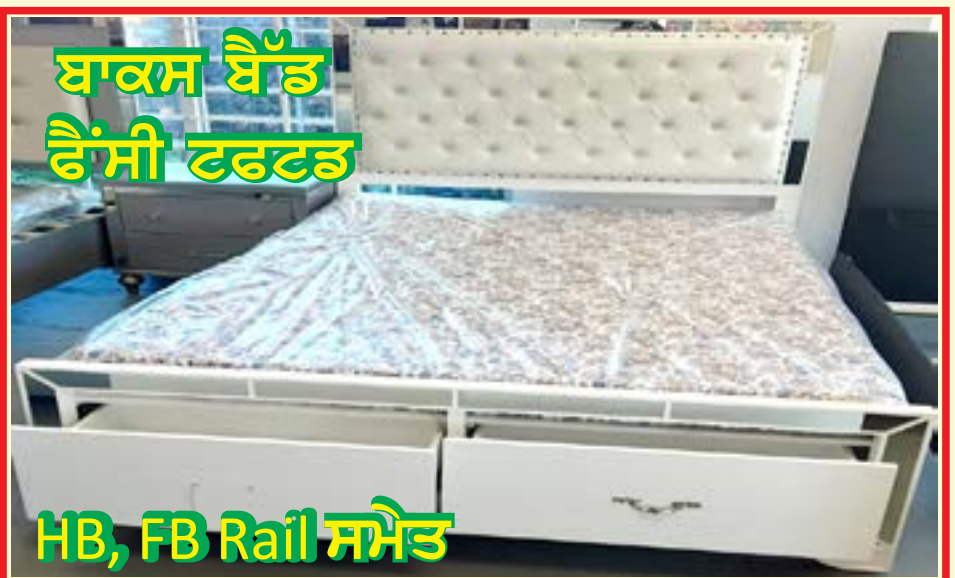
ਬਾਕਸ ਬੈੱਡ ਫੈਂਸੀ ਫਰਫਟ