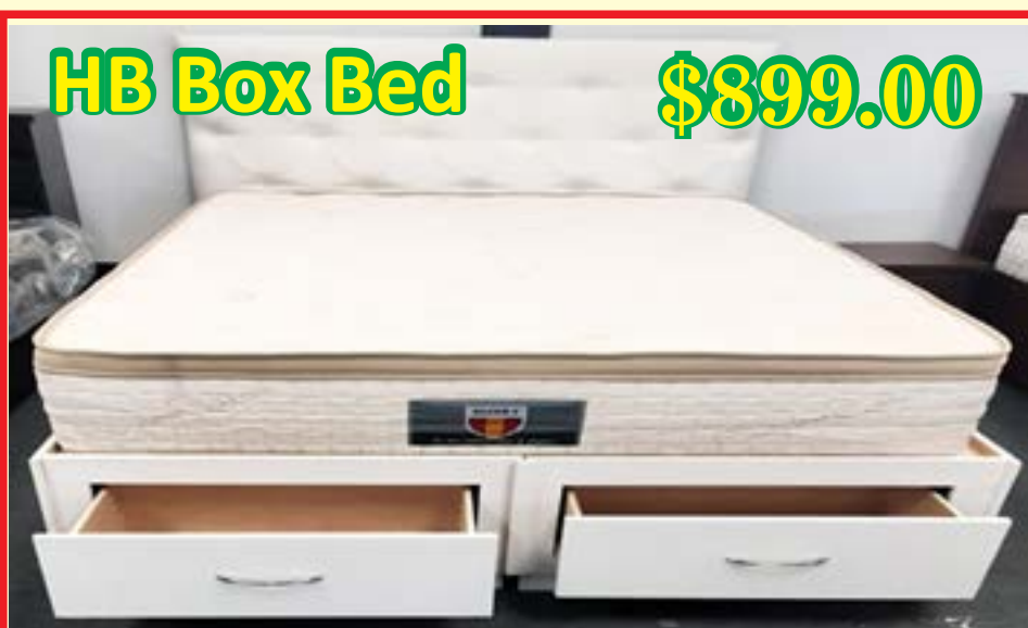
HB Box Bed $899.00