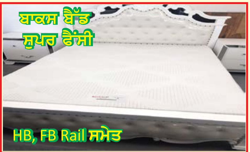
ਬਾਕਸ ਬੈੱਡ ਸੁਪਰ ਫੈਂਸੀ